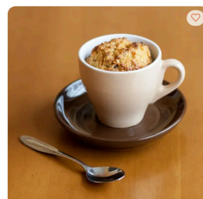
Banana Bread in Mug